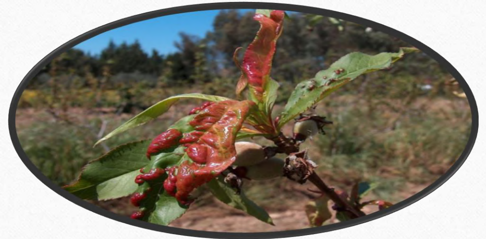
Коврцавост листа брескве

Што се тиче биљних болести, код нектарине и брескве које су у фазама бубрења пупољака и у влажним условима може доћи до остварења инфекције гљивом проузроковачем коврцавости листа брескве. Са порастом температура ваздуха прве падавине могу створити повољне услове за инфекцију овог патогена. Високе дневне температуре у претходном периоду довеле су до излазка обичне репине пипе. У току је и насељавање одраслих јединки житне пијавице на усјеве озимих стрнина и почетак полагања јаја.