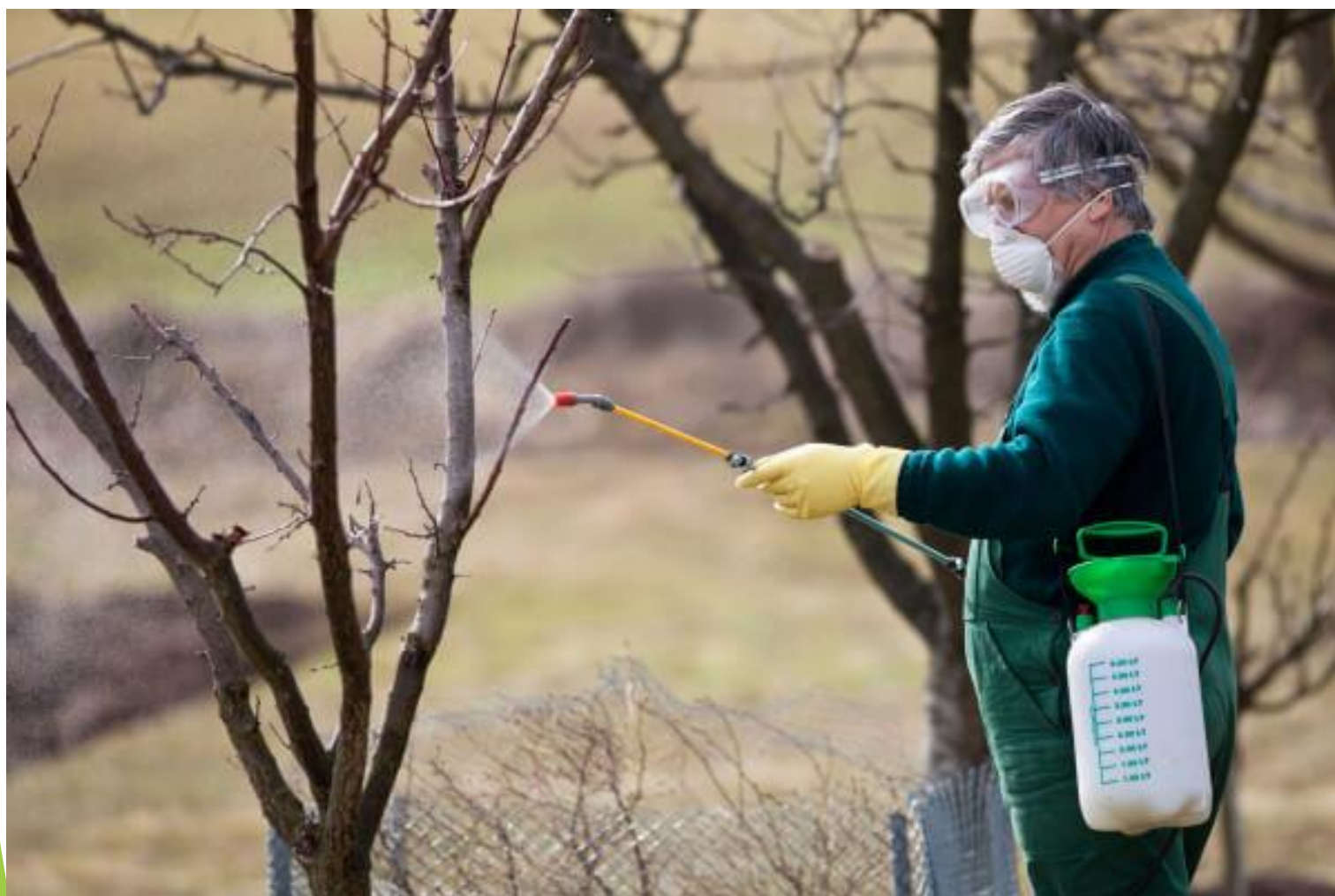
Слика 5 - Дезинфекција