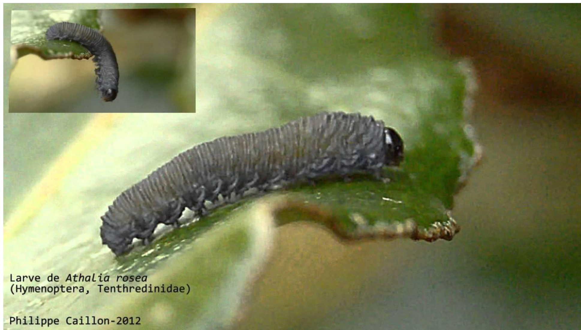
Слика 6- Гусјеница репичине лисне осе