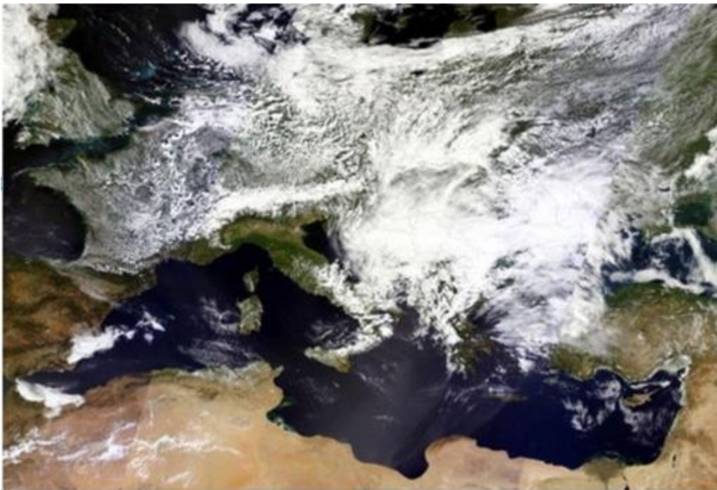
Слика 1: Облачни систем са центром изнад Србије, снимак свемирске агенције објављен 14. 05. 2014

Овако интензивне падавине су више карактеристичне за крајеве са средоземним падавинским режимом и његовим модификацијама. (Појам повратног периода је везан за вјероватноћу с којом се јавља измјерена вредност. Хиљадугодишња киша значи да је вјероватноћа да се бар једанпут оствари, у свакој појединачној години, у наредних 1000 година, једнака 0.1%).